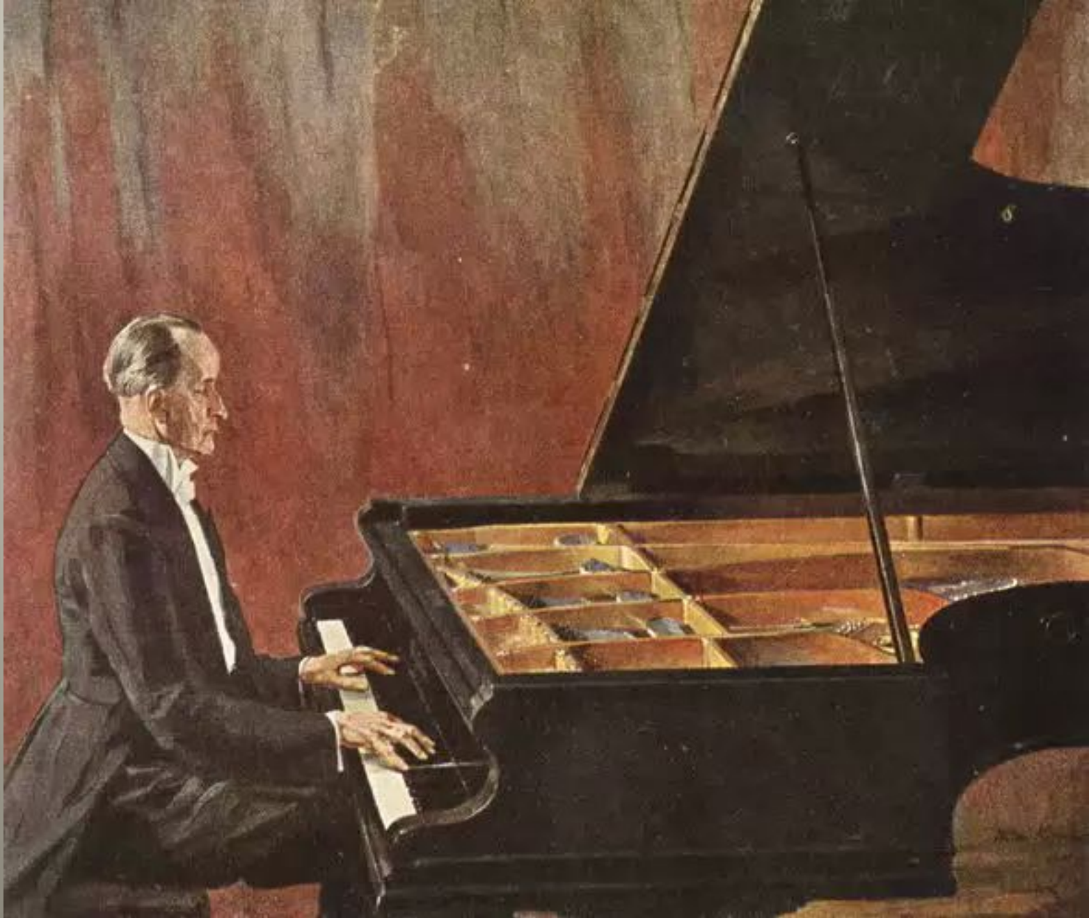
П.Д. Корин (1892-1967) Портрет пианиста К.Н. Игумнова