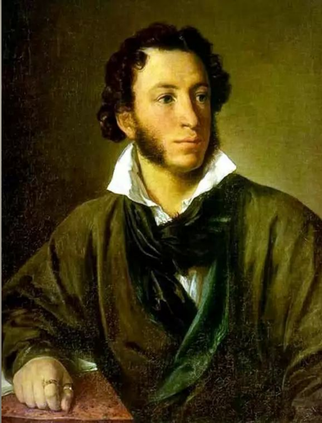
ТРОПИНИН Василий Андреевич. Портрет А. С. Пушкина. 1827.