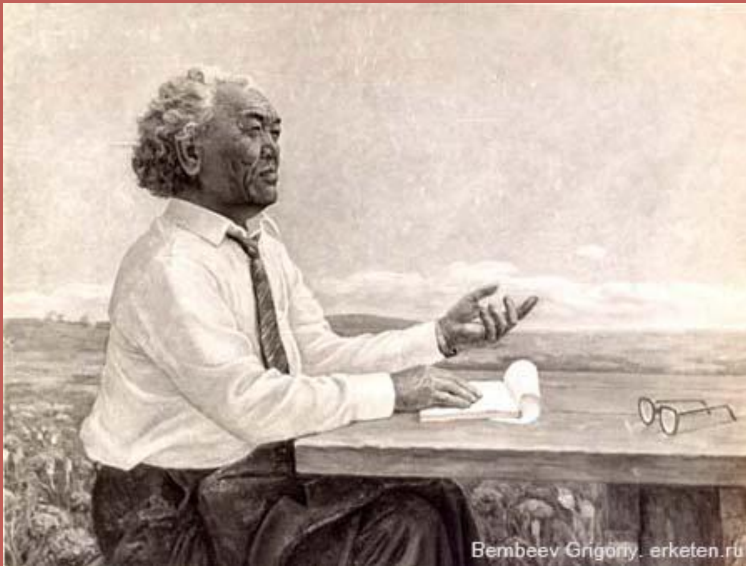
Калмыцкий поэт и писатель Давид Никитич Кугультинов