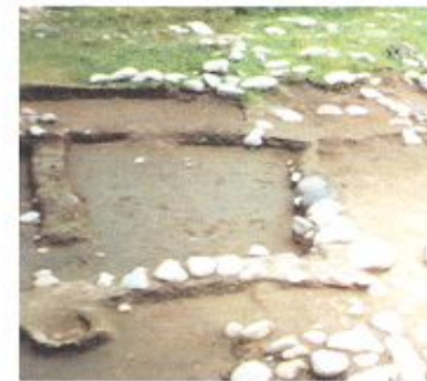
Үй-жайдың ірестесі, Талғар