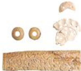
Сүзектен қаша жасалған әр түрлі пішіндегік бұйымдар. X – XII ғ. Талхир