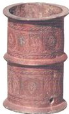
Қызыл жалын аяқ ... аяқталған айна. XII – XIII ғ. Талхир