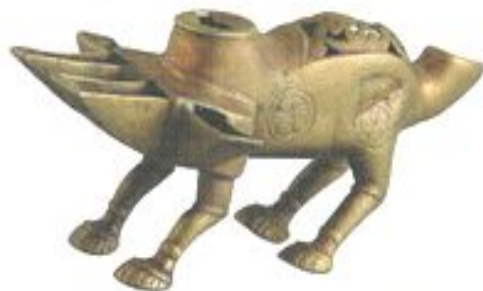
Шырақ. XII – XIII ғ. Қола. Талхир