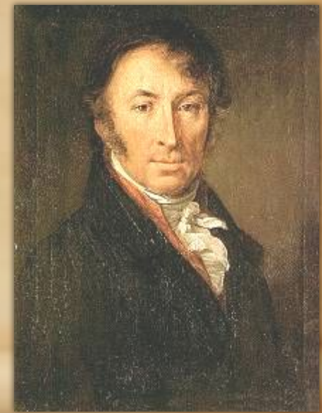
Карамзин Николай Михайлович

Следует отметить, что в «Истории государства Российского» (1816-1829 гг.) Н. М. Карамзин букву Ё не использовал.