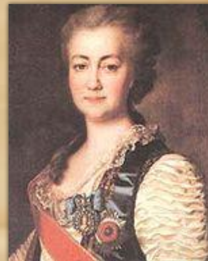
Княгиня Е. Р. Воронцова-Дашкова

Доводы Дашковой показали убедительными, и её предложение было утверждено общим собранием Академии.