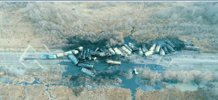
Крушение ст. Мегет В-СИБ 28.01.2020