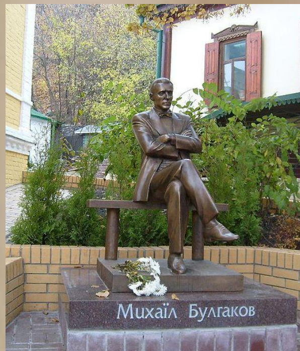
Открытый в октябре 2007 года памятник Булгакову возле его дома-музея в Киеве