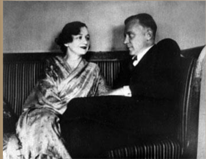
апрель 1935 года, Елена Сергеевна, М. А.Булгаков

В 1929 году Булгаков знакомится с Еленой Сергеевной Шиловской, будущей третьей женой.