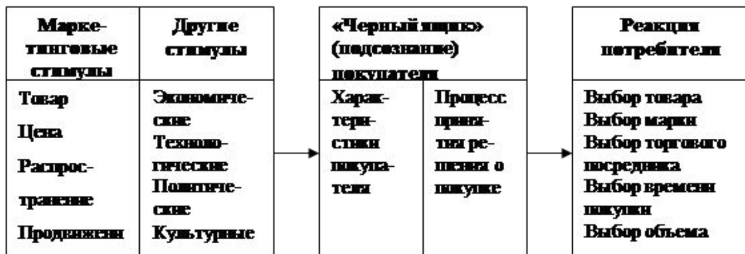
Рис. 1. Модель покупательского поведения