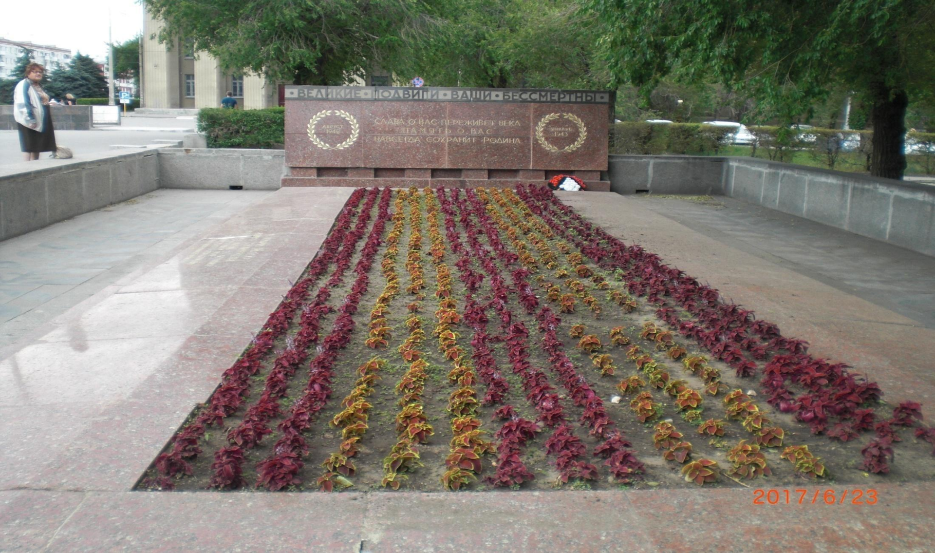
Братская могила бойцам 13 стрелковой и 10 дивизии НКВД в Волгограде