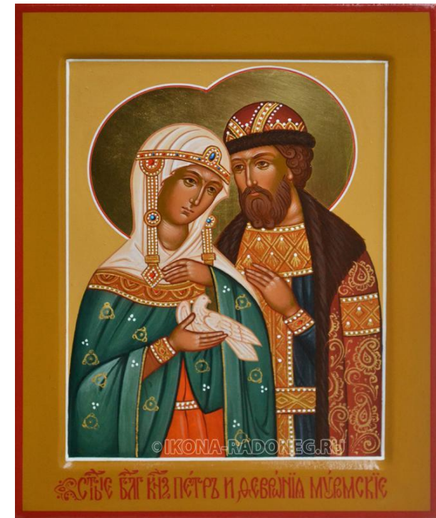
Повесть о Петре и Февронии Муромских

Вплоть до конца XVII столетия народная медицина занимала на Руси ведущее положение. Опыт русской народной медицины отражен в многочисленных исторических повестях того времени. Народная русская медицина исключительно богата.