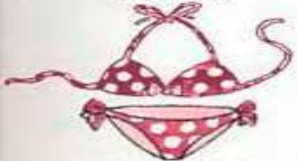
der Bikini бикини