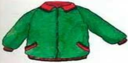
die Jacke куртка