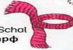
der Schal шарф