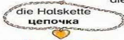
die Halskette цепочка