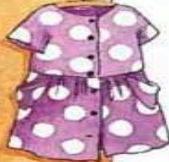
das Kleid платье