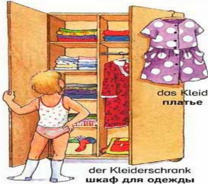
der Kleiderschrank шкаф для одежды