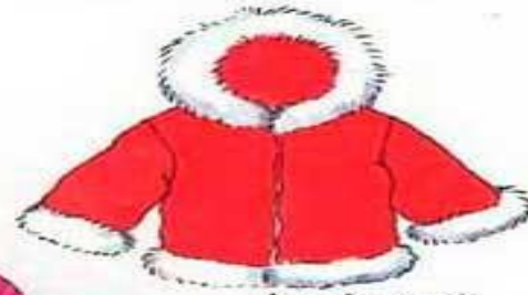
der Anorak зимняя куртка