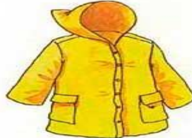
die Regenjacke плащ