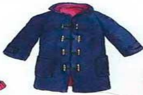
der Mantel пальто