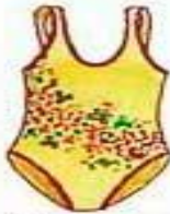
der Badeanzug купальник