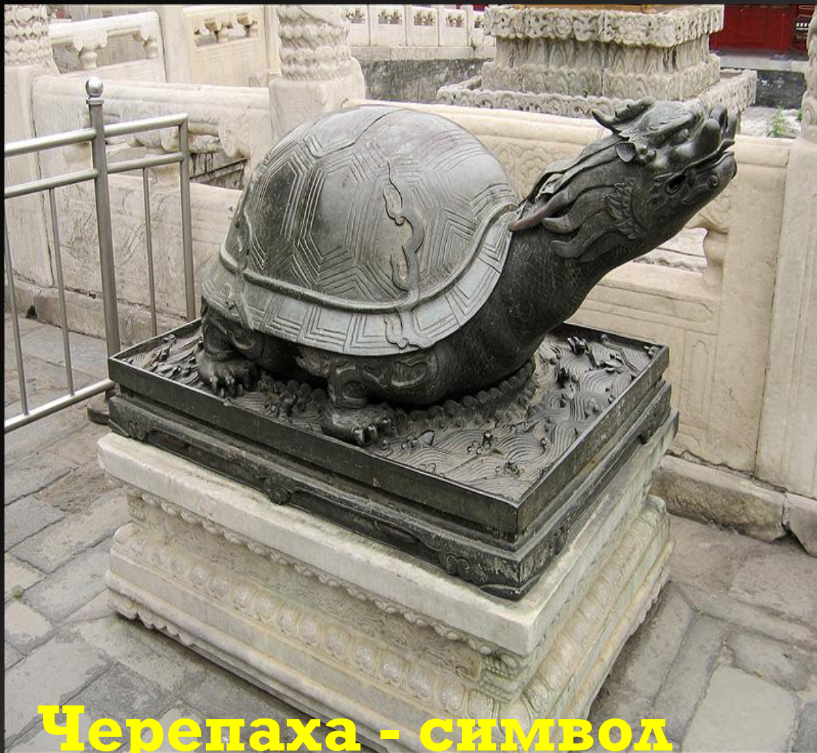
Черепаша - символ довголіття