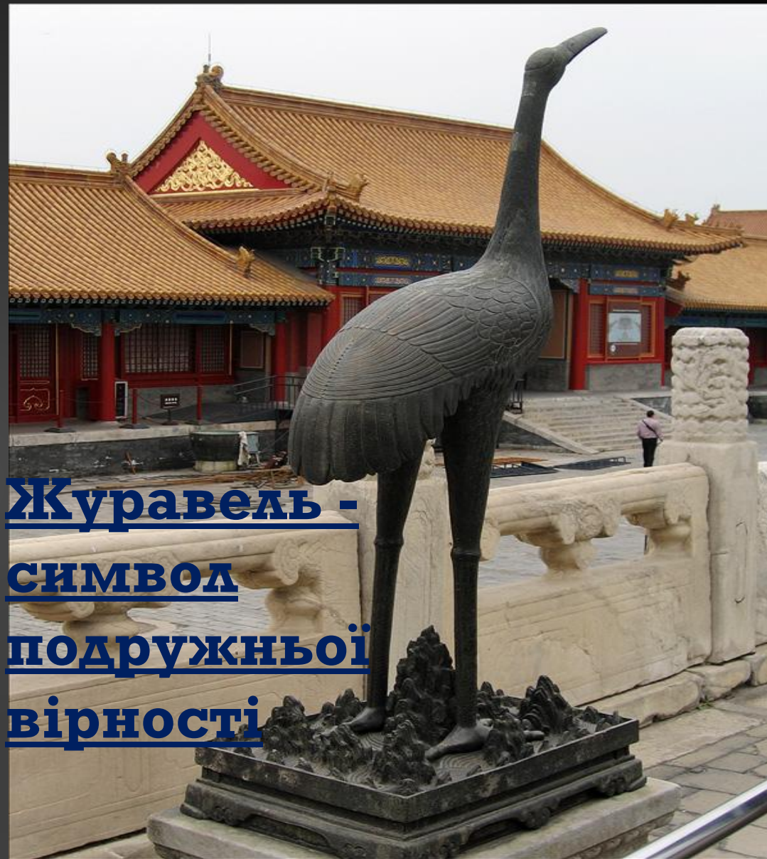
Журавель - символ подружньої вірності