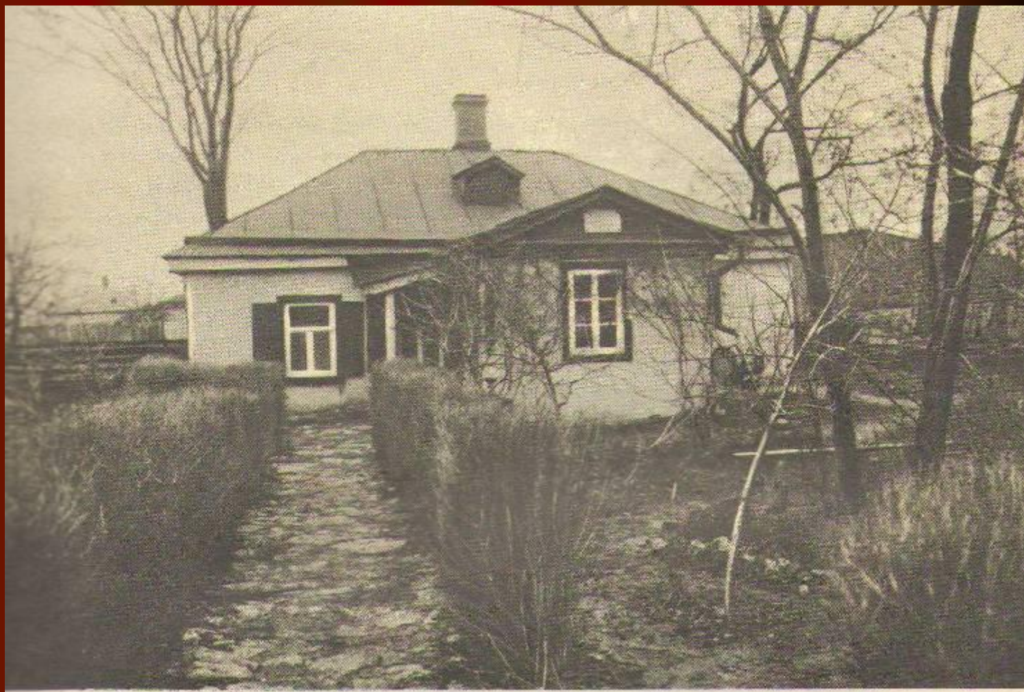
Дом, где родился А.П.Чехов (г. Таганрог, ул. Чехова, д.69)