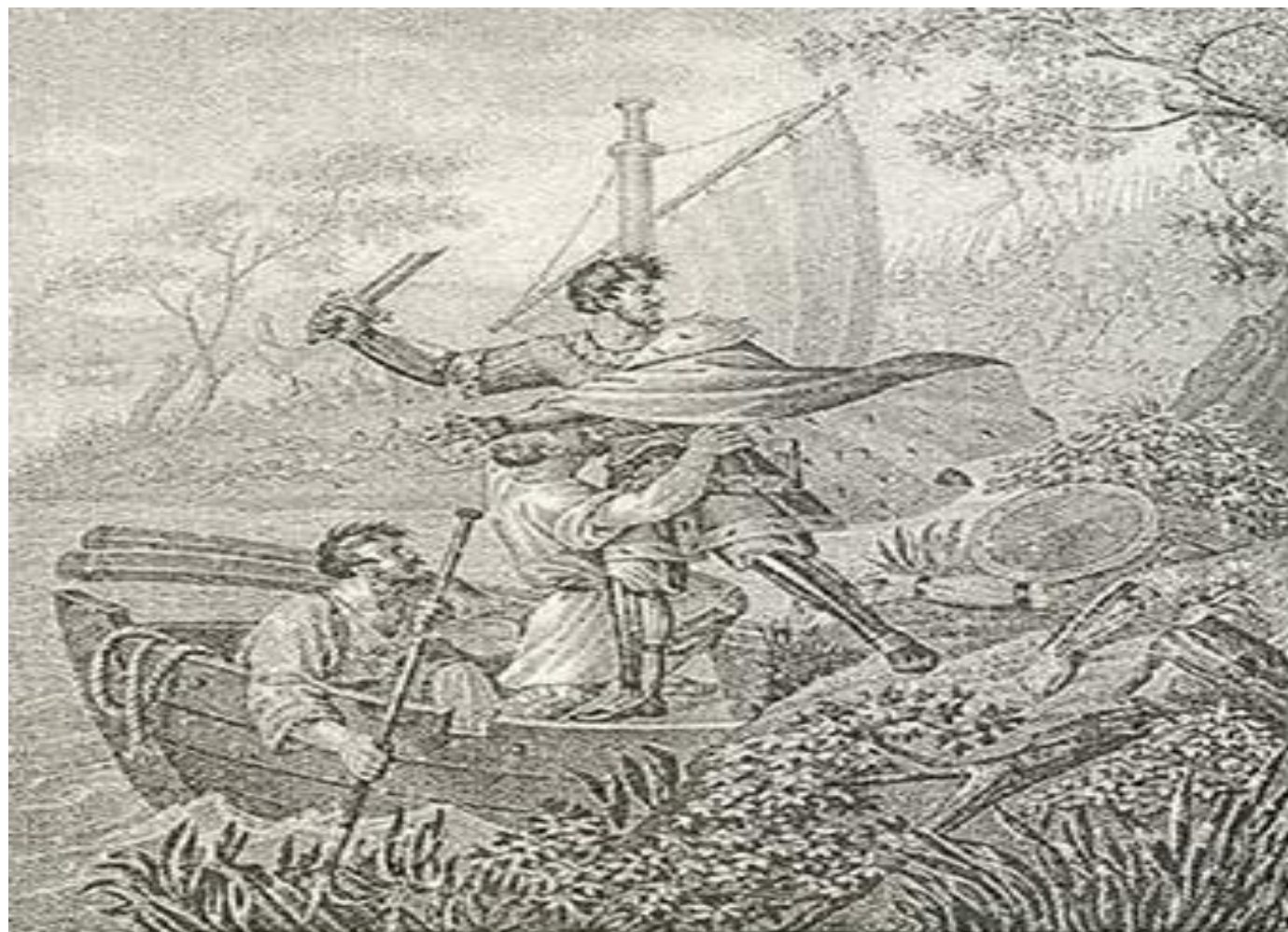
КЕЛКА И ПАВЛИЦКОЙ МОТРИЦАВЪ, справивъ грузинъ при Кавказе, отъясненъ за Астрахъ 1824. года.