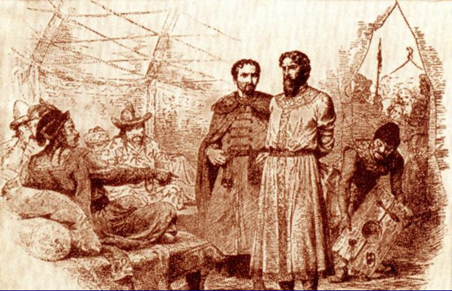
Тверской князь Михаил у хана Узбека