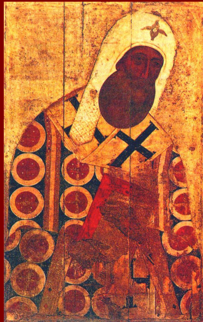
Митрополит Петр (икона)