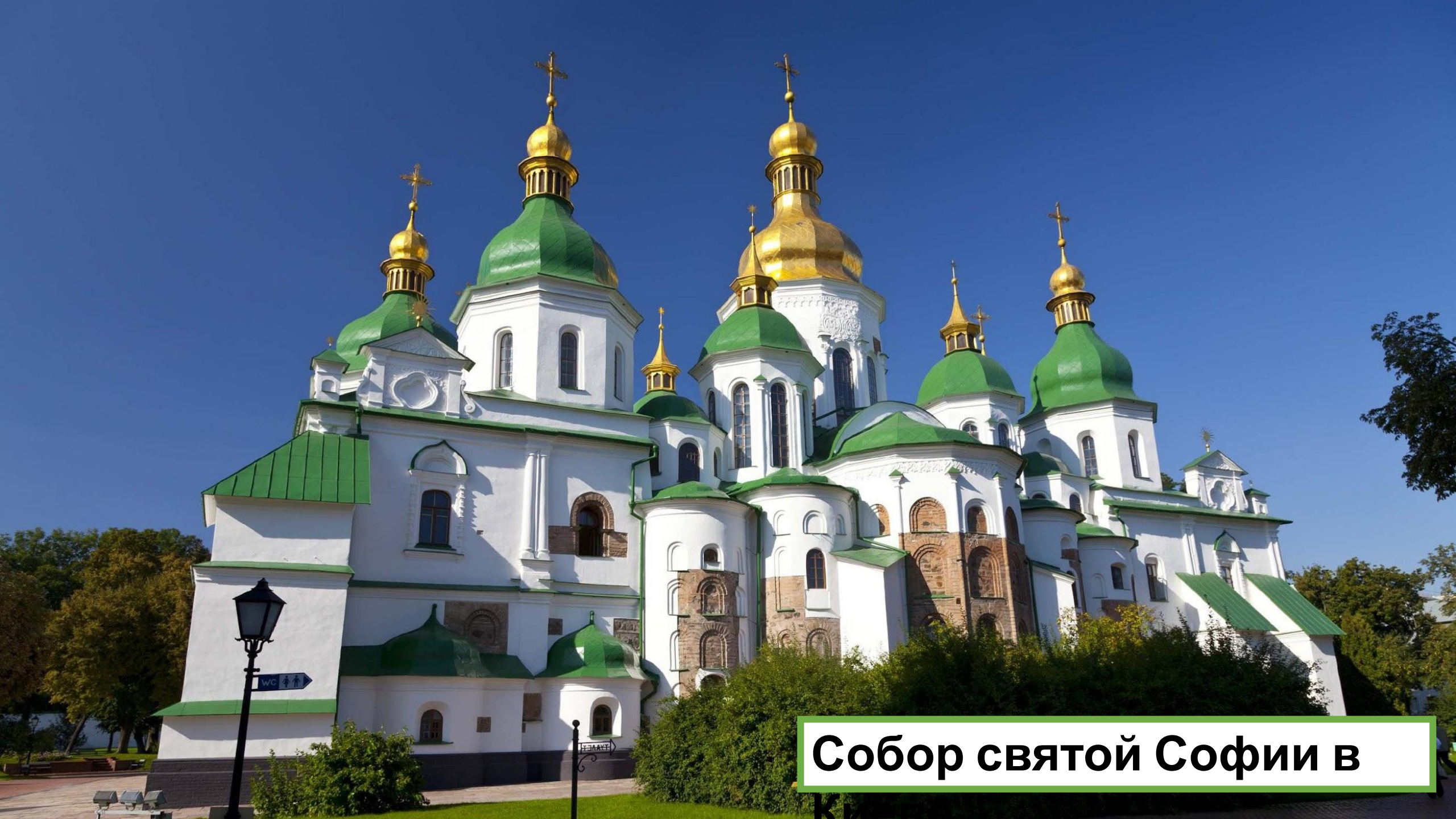
Собор святой Софии в