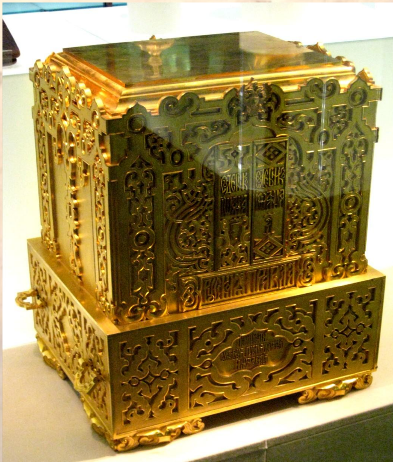
Золотой ковчег, в котором хранилась «Русская правда».