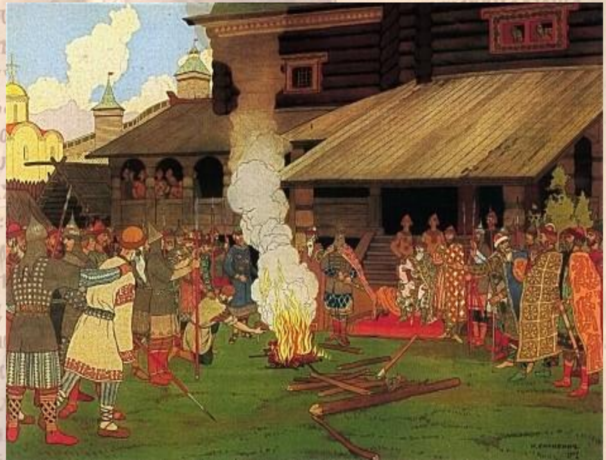
Суд во времена «Русской правды».

1016 г. – был создан первый на Руси свод законов «Русская правда»