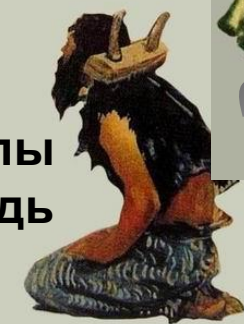
Холопы (челядь )