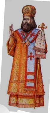
Верхи духовенства Старшие