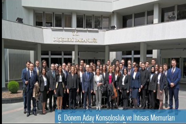
6. Dnem Aday Konsolosluk ve İhtisas Memurları