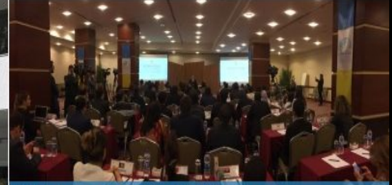
22. Uluslararası Genç Diplomatlar Eđitim Programı