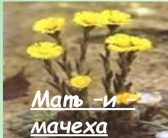
Мать -и - мачеха