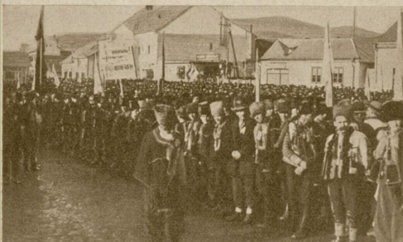
Святкування Дня Злуки в Ясіні. 22 січня 1939 року.

Це була не просто маніфестація, а найбільша за 20 років перебування краю у складі Чехословаччини демонстрація місцевого населення за участю