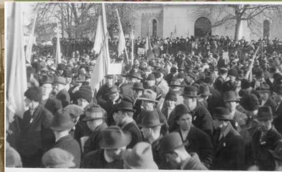
Святковий мітинг на День Злуки. Хуст, 22 січня 1939 року.