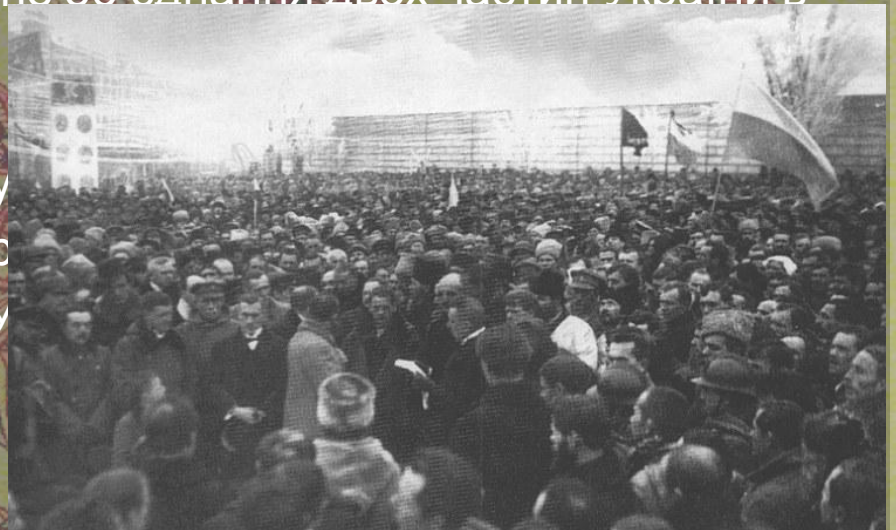
Урочисте проголошення Акту Злуки УНР і ЗУНР на Софійській площі в Києві. 22 січня 1919 р.

22 січня 1919 року на Софійському майдані в Києві в урочистій атмосфері відбулося проголошення Акта злуки У та ЗУНР в єдину незалежну державу.