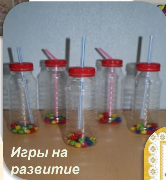
Игры на развитие речевого дыхания