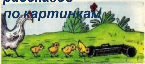
Составление рассказов по картинкам