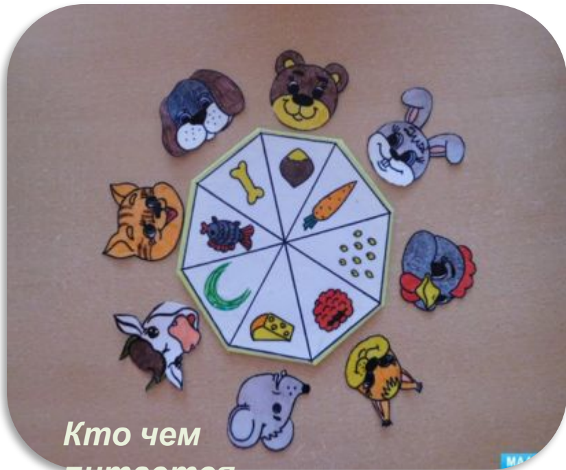
Кто чем питается