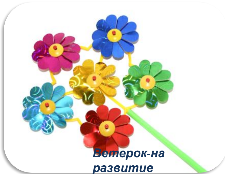
Ветерок-на развитие речевого дыхания