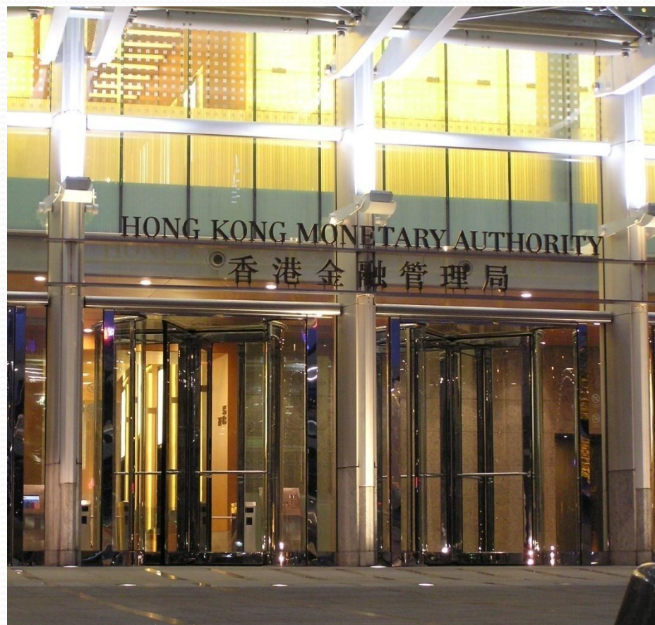
Вход в здание « Hong Kong Monetary Authority »