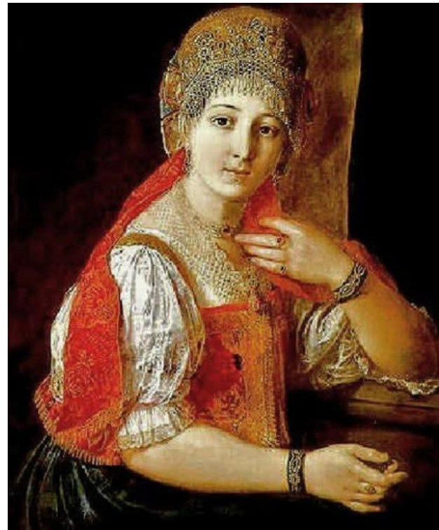
Елена Глинская - мать