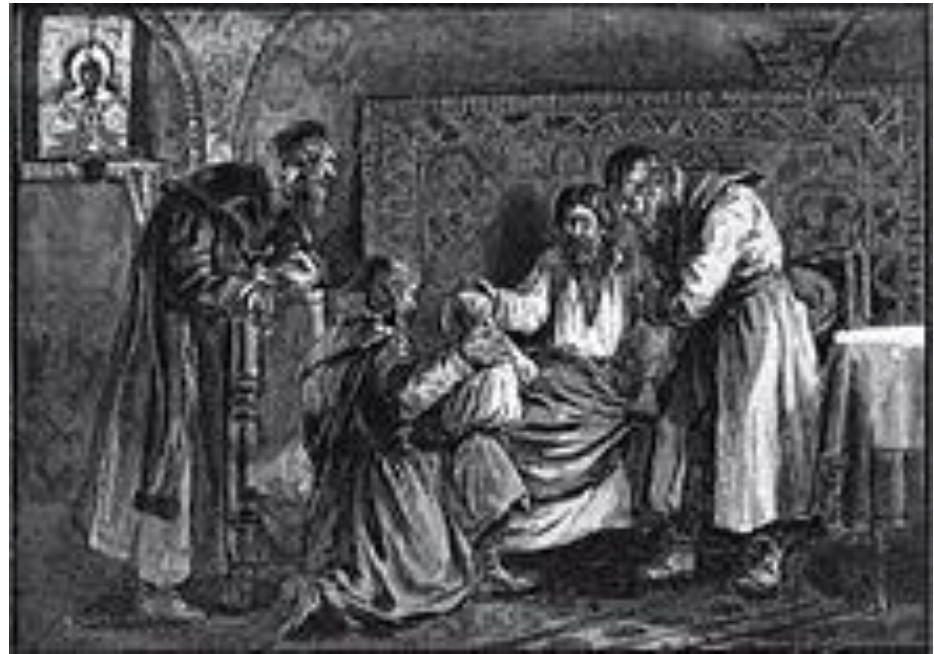
Василий III благословляет сына своего Ивана IV перед своей кончиной

Опекуны должны были беречь Ивана, пока он не достигнет 15 лет.