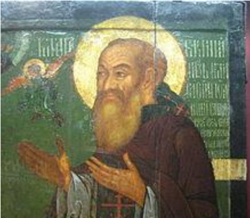
Василий III - отец