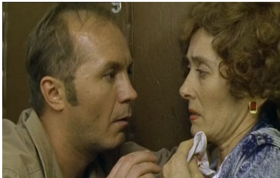
Андрей Панин - Гаркуша