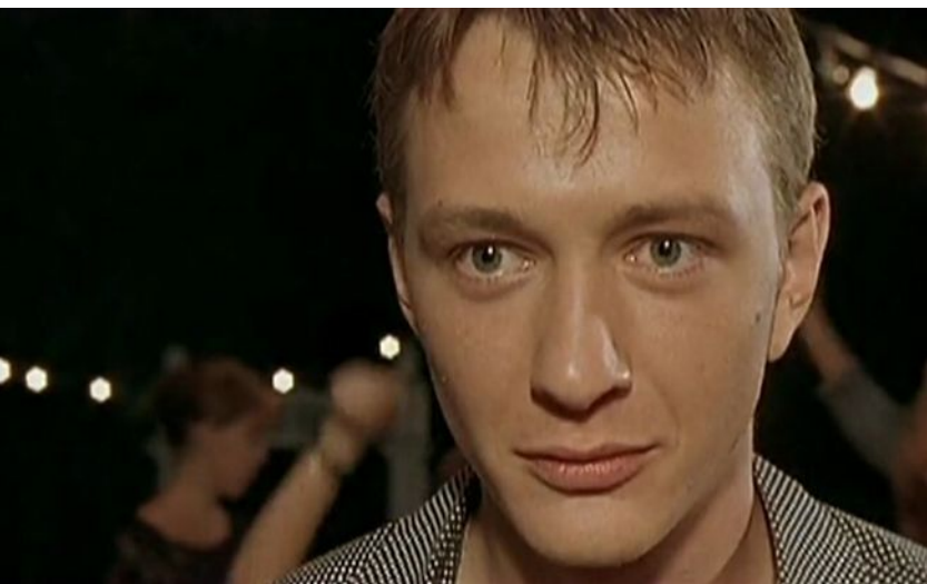
Марат Башаров - Мишка Крапивин