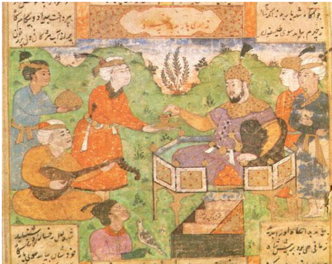
Ізтілеуов Тұрмағамбет «Шаһнамасы»