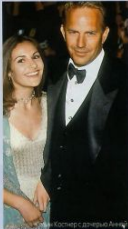
Кевин Костнер с дочерью Аннией