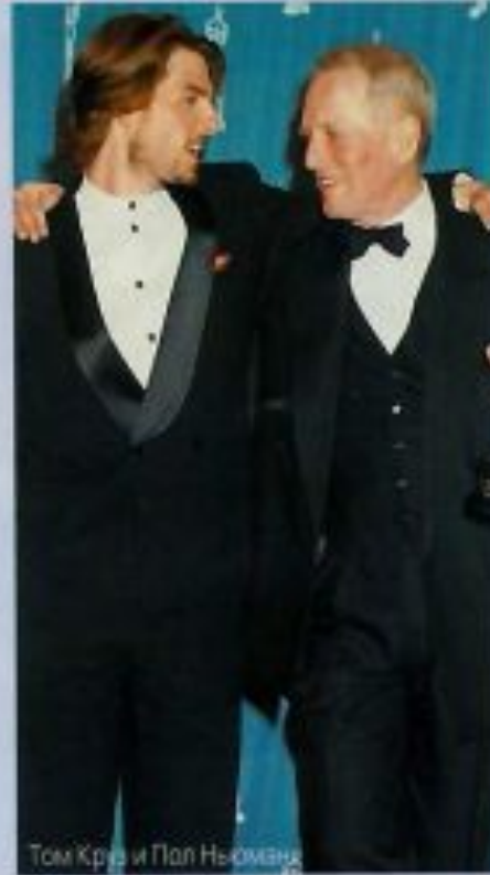
Том Круз и Пол Ньюман