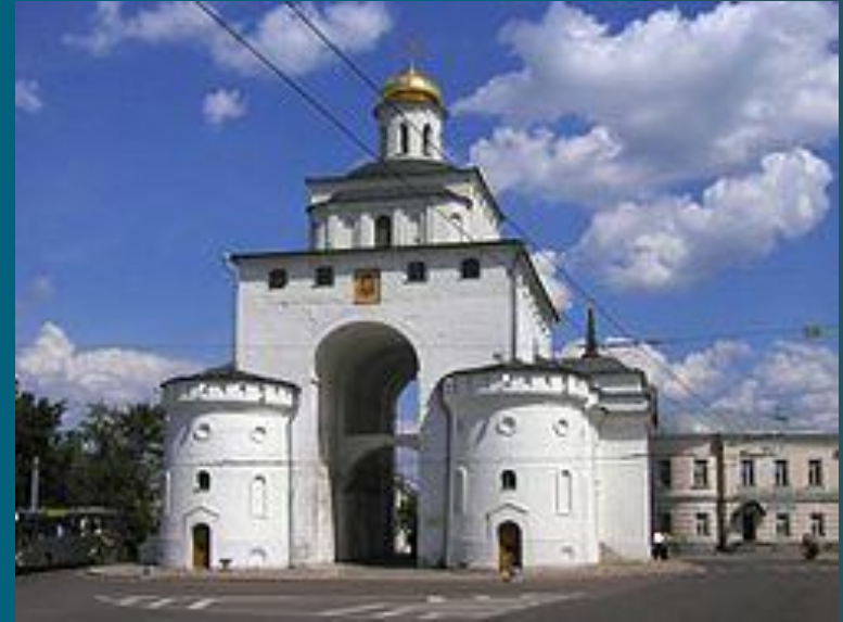
Золотые ворота во Владимире. Центральная часть с проездной аркой сохранилась с середины XII века

В период политической раздробленности роль Киева как политического центра начала ослабевать, в удельных центрах появились значительные архитектурные школы. В XII—XIII веках важнейшим культурным центром стало Владимиро-Суздальское княжество. Уникальность владими́ро-суздальского зодчества состоит в том, что оно не просто продолжило традиции византийской и южнорусской архитектуры, но и значительно обогатило их западноевропейскими идеями и элементами.