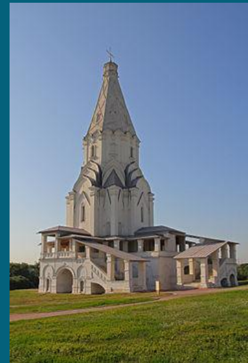
Церковь Вознесения в Коломенском

Принятие Иваном Грозным титула «царя» и превращение России в царство было очередным этапом развития русского государства и русской архитектуры в том числе. В архитектуре данного периода продолжают прошлые традиции, при этом в каменную архитектуру из деревянной проникает форма «шатра», что является заметным отличием в архитектуре нового периода.