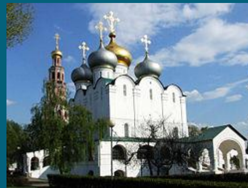
Смоленский собор Новодевичьего монастыря (1524—1598)