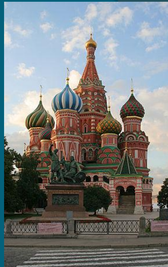
Покровский собор (Храм Василия Блаженного)

Русская архитектура следует за традицией, корни которой были установлены ещё в Византии, а затем в Древнерусском государстве. После падения Киева русская архитектурная история продолжалась во Владимиро-Суздальском княжестве, Новгородской и Псковской республиках, Русском царстве, Российской империи, Советском Союзе и современной Российской Федерации.