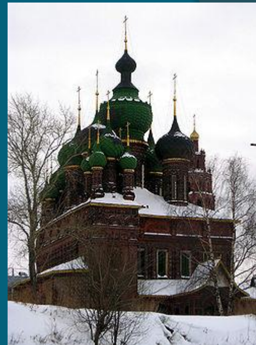
Церковь Иоанна Предтечи в Ярославле (1687)

Начало XVII века в России ознаменовалось сложным смутным временем, что привело к временному упадку строительства. Монументальные здания прошлого века сменились небольшими, иногда даже «декоративными» постройками. Примером подобного строительства может служить церковь Рождества Богородицы в Путинках, выполненная в характерном для того периода стиле русского узорочья. После завершения строительства храма, в 1653 году, Патриарх Никон прекратил строительство каменных шатровых храмов на Руси, что сделало церковь одной из последних выстроенных с применением шатра.