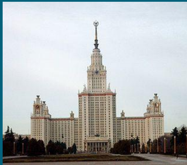
Главное здание МГУ

Стиль сталинской архитектуры сформировался в период проведения конкурсов на проекты Дворца Советов и павильоны СССР на Всемирных выставках 1937 года в Париже и 1939 года в Нью-Йорке. После отказа от конструктивизма и рационализма было решено перейти к тоталитарной эстетике, характеризующейся приверженностью монументальным формам, часто граничащим с гигантоманией, жёсткой стандартизацией форм и техник художественного представления.