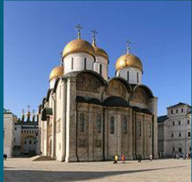
Успенский собор Московского Кремля

Превращение Москвы в сильный политический центр привело к стремительному развитию архитектуры на территории города и княжества. Архитектурные традиции Владимиро-Суздальского княжества успешно перенимались московскими зодчими, к концу XVI века уже можно говорить о собственной московской архитектурной школе.