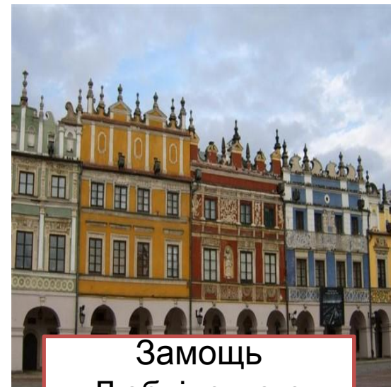
Замок Люблінського воєводства