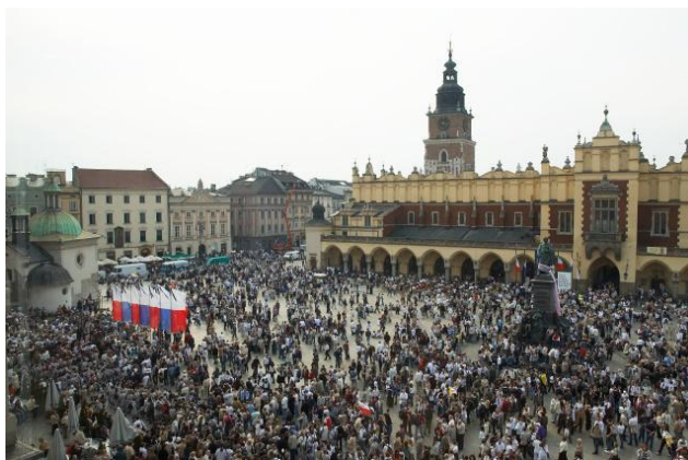
Торгова площа і Старе місто Кракова