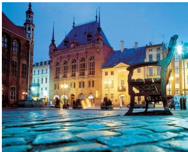
Старий город - Торунь