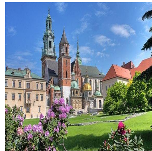
Вавельський замок і кафедральний собор в Кракові