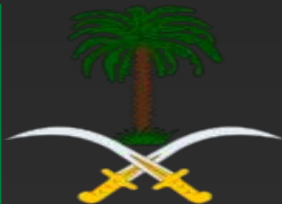
Сауд Арабияның елтаңбасы

Ұраны: <Аллаһтан басқа құдай жоқ, Мұхаммед Аллаһтың елшісі>