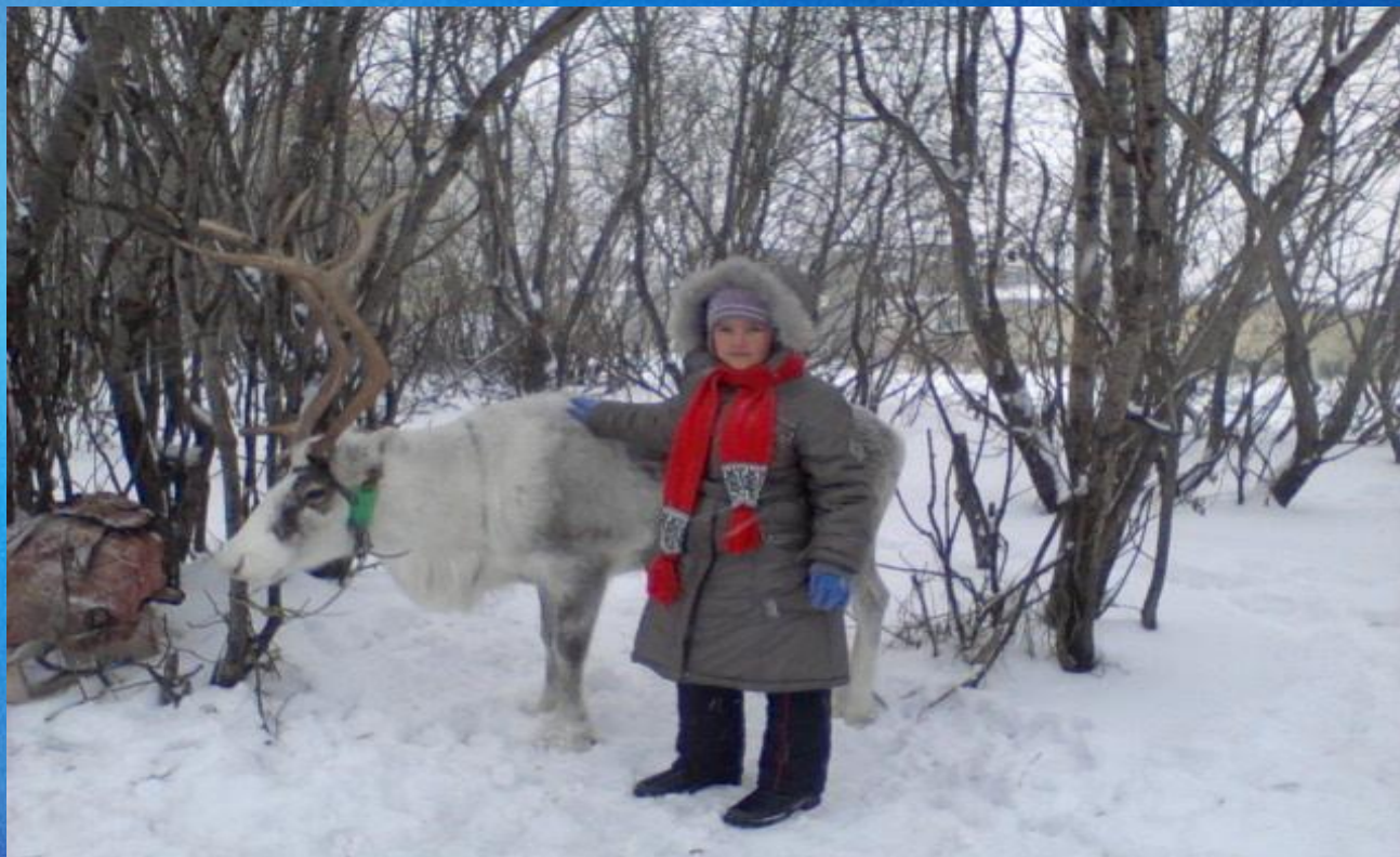
Возят груз большой без лени В тундре северной олени: Хоть копыта и не шины, - Выполняют роль машины.