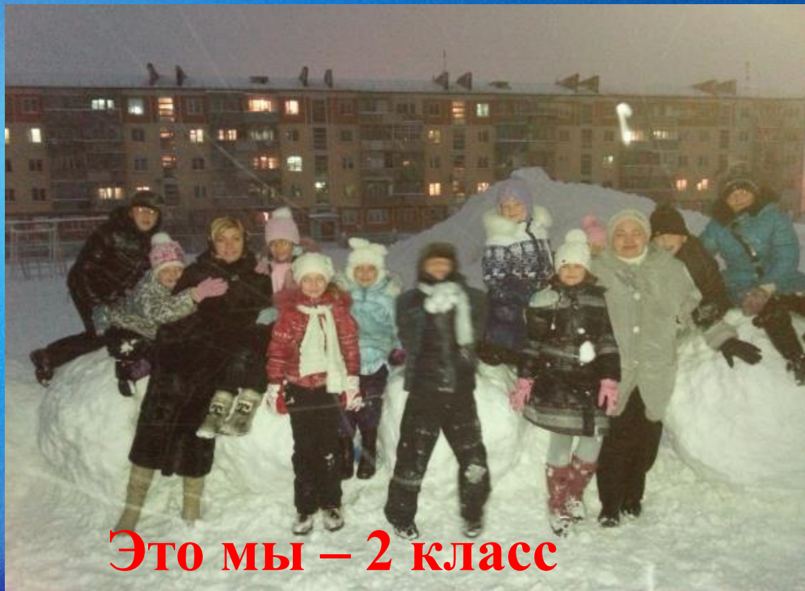
Это мы – 2 класс