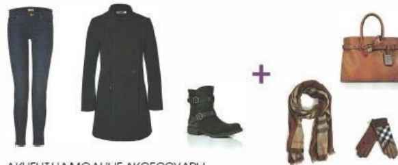
АКЦЕНТ НА МОДНЫЕ АКСЕССУАРЫ