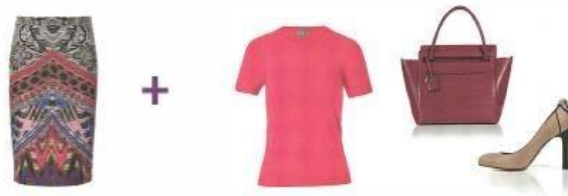
АКЦЕНТ НА МОДНУЮ ОДЕЖДУ