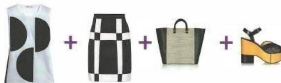
АКЦЕНТ НА МОДНУЮ ОДЕЖДУ И АКСЕССУАРЫ