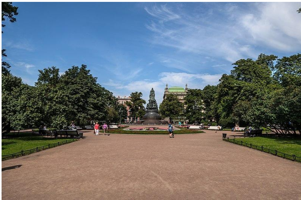
Площадь Островского в Санкт-Петербурге

В конце 1836 года Даль приезжал в Петербург. В 1841 году Даль по рекомендации своего начальника В. Перовского был назначен секретарём его брата Л. А. Перовского, а потом заведовал (частно) особой канцелярией его, как министра внутренних дел. С 1841 по лето 1849 года жил в Петербурге в казённом доме по адресу: Александрийская площадь (площадь Островского), 11.