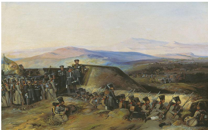
Боевой эпизод русско-турецкой войны 1828—1829 годов

В ходе сражений русско-турецкой войны 1828—1829 годов и польской кампании 1831 года Владимир Даль показал себя как блестящий военный врач.