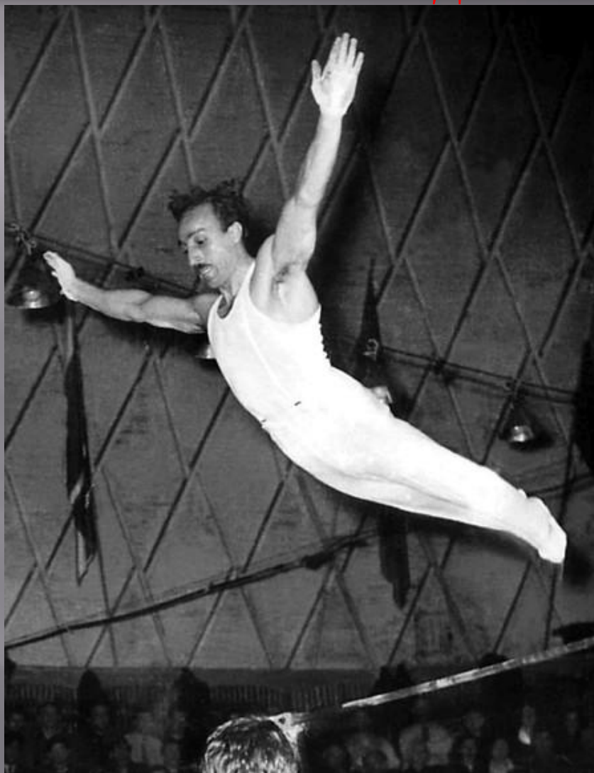
Армянский гимнаст Грант Шагинян.