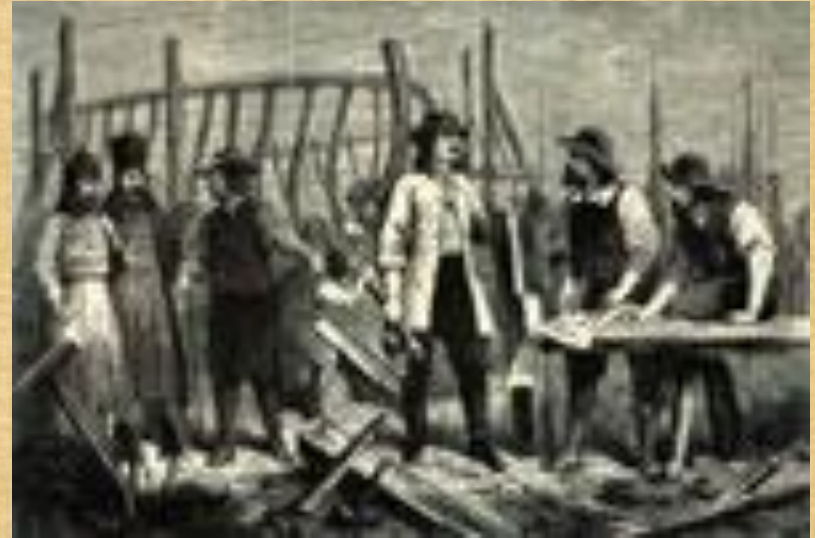
Петр на верфи

ОТВЕТ: ВСЕГО ПЁТР I ОСВОИЛ ОКОЛО 15 ПРОФЕССИЙ, В ТОМ ЧИСЛЕ ПЛОТНИКА, СТОЛЯРА, СЛЕСАРЯ, КУЗНЕЦА, ФЕЛЬДШЕРА, ПЕРЕВОДЧИКА, БУХГАЛТЕРА, КАРТОГРАФА, ШТУРМАНА, АРТИЛЛЕРИСТА, КОРАБЛЕСТРОИТЕЛЯ.