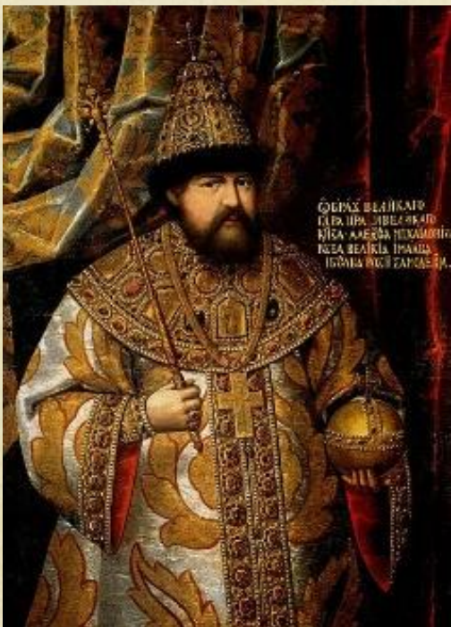
Первый портрет — парсуна.