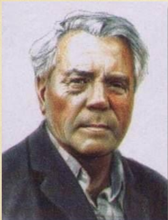
Виктор Петрович Астафьев (1924–2001 гг.)