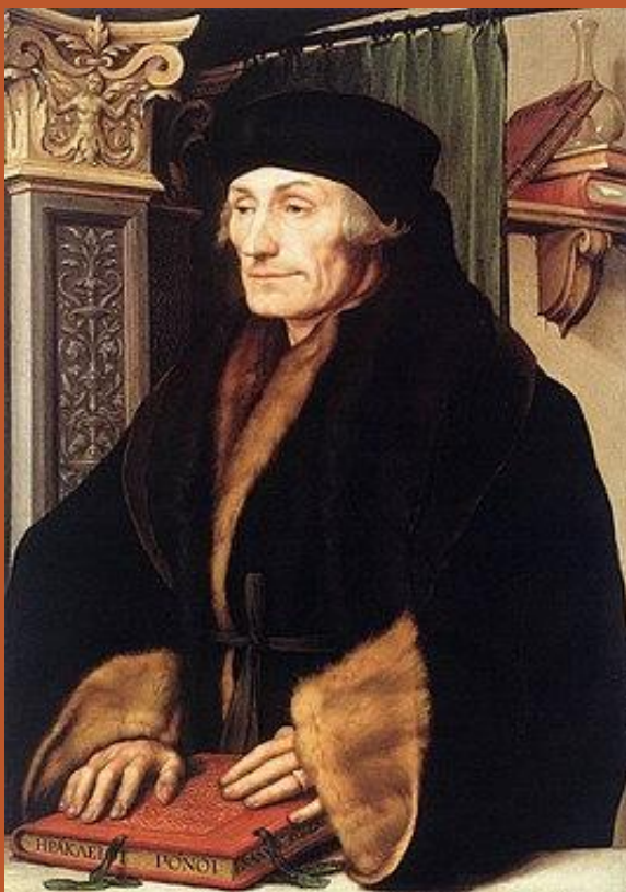
Эразм Роттерда́мский, (28 октября 1469— 12 июля 1536)