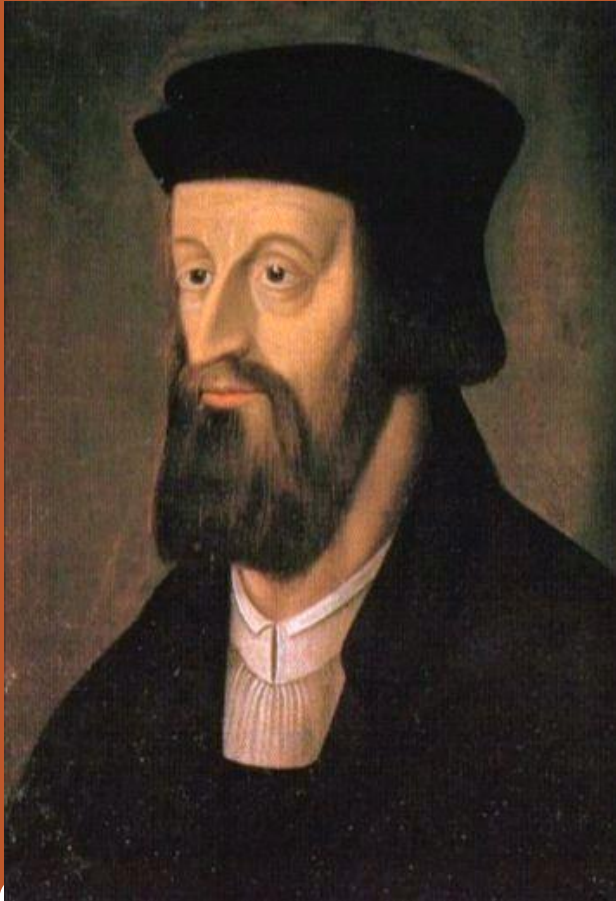
Ян Гус (1369, — 6 июля 1415)