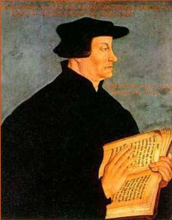
Ульрих Цвингли ( 1 января 1484 — 1 1 октября 1531 )