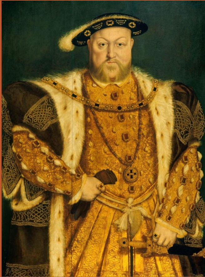
Генрих VIII Тюдор ( 28 июня 1491 — 28 января 1547)

В 1529 г. король Генрих VIII Английский начал проводить политику, в результате которой Церковь Англии отделилась от Рима. Первопричиной этого стало настойчивое желание Генриха иметь наследника и отказ папы разрешить ему развод. Акт апелляций (1533 г.) положил конец юрисдикции Рима в Англии. Акт превосходства (1534 г.) совершенно упразднил власть папы, даровав королю звание верховного главы Церкви Англии.