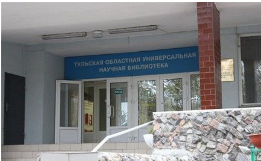
Тульская областная универсальная научная библиотека