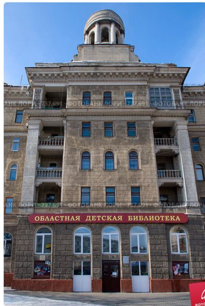
Тула. Областная детская библиотека.