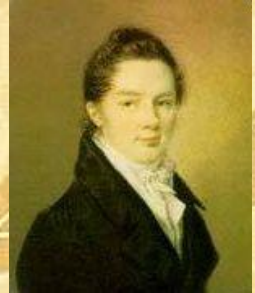
Иван Иванович Пуцин

Пушкин сохранил лицейскую дружбу и культ Лицея на всю жизнь.