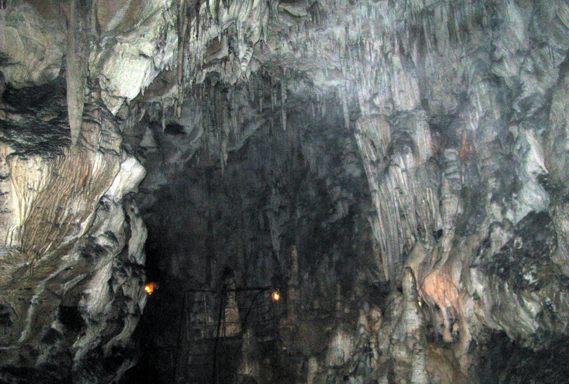
Большая Азишская пещера состоит из нескольких крупных залов