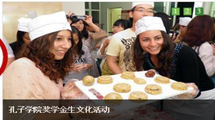
孔子学院奖学金生文化活动