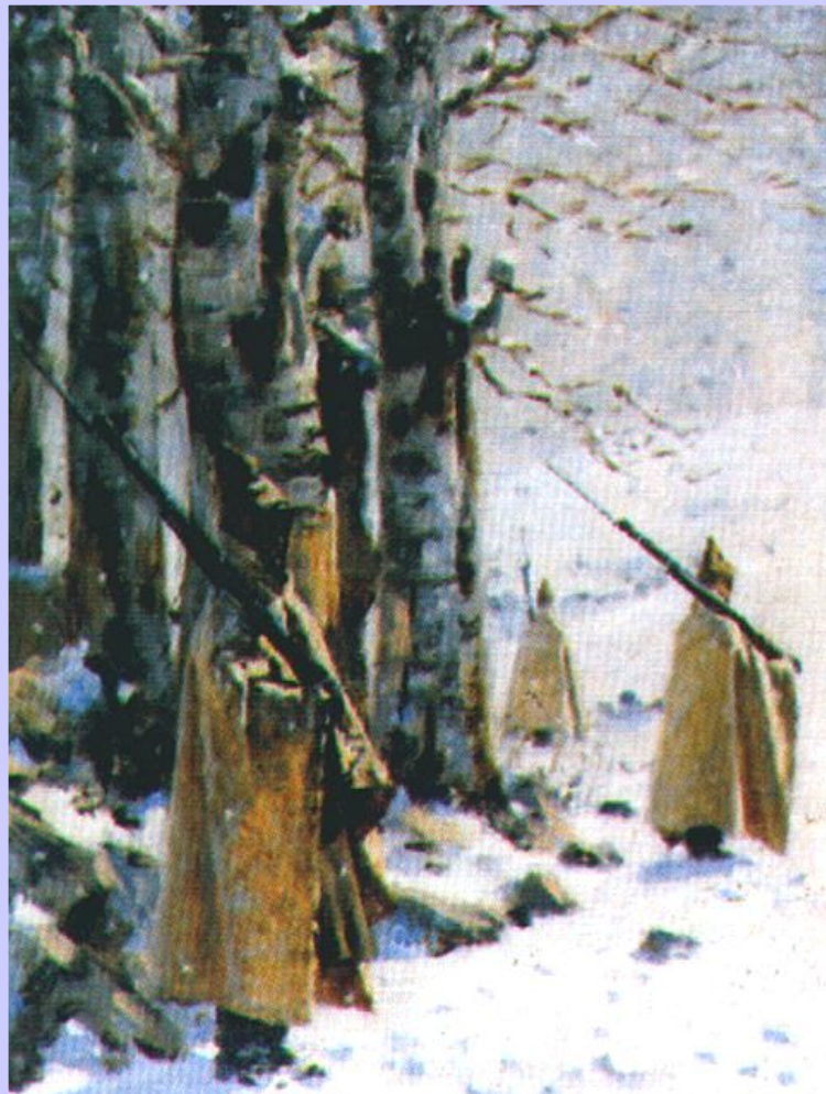
В.Верещагин. Шикет на Балканах

Пока русское командование выясняло расположение своих отрядов турки неожиданно ударили по Плевне и заняли город, создав угрозу для тыла русской армии.