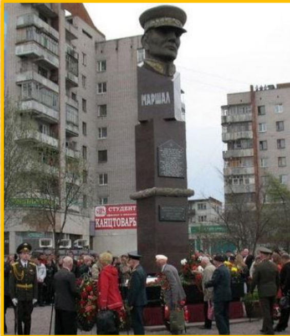
Памятник И.С. Коневу в Вологде