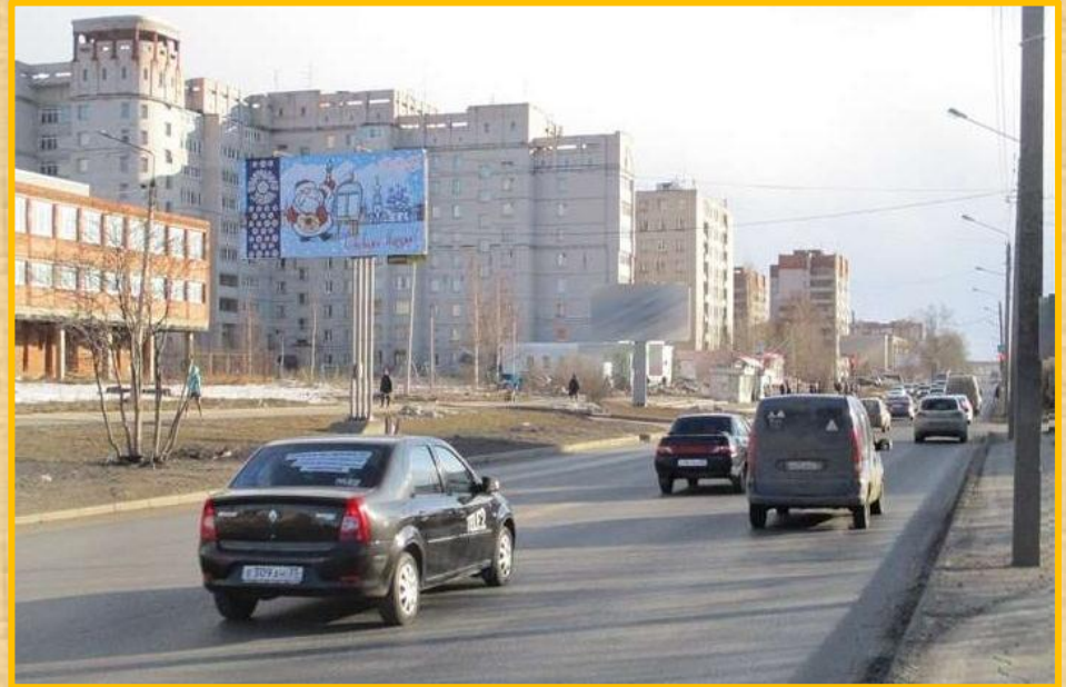
Улица Маршала Конева в Вологде