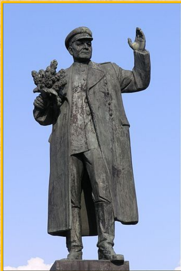
г. Прага, Чехия