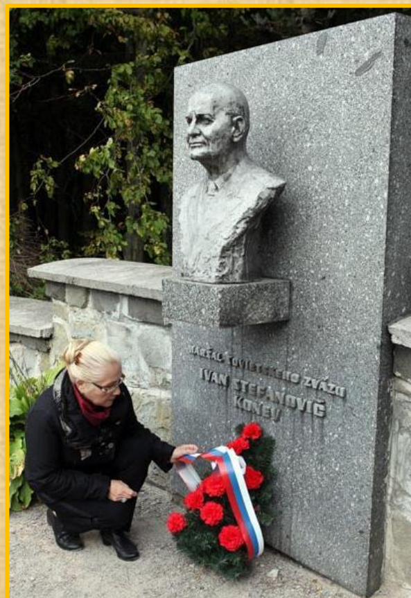
г. Свидник, Словакия