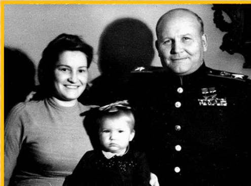
В кругу семьи