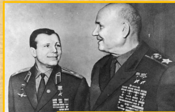
С Ю.А. Гагариным