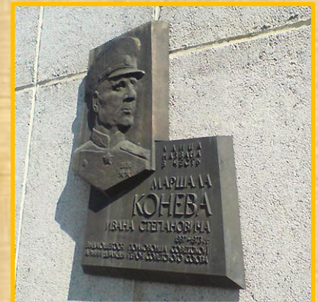
Памятная доска на доме № 1 ул. Маршала Конева в Вологде