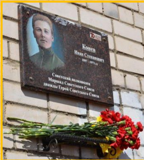
Мемориальная доска И.С. Коневу в Вологде