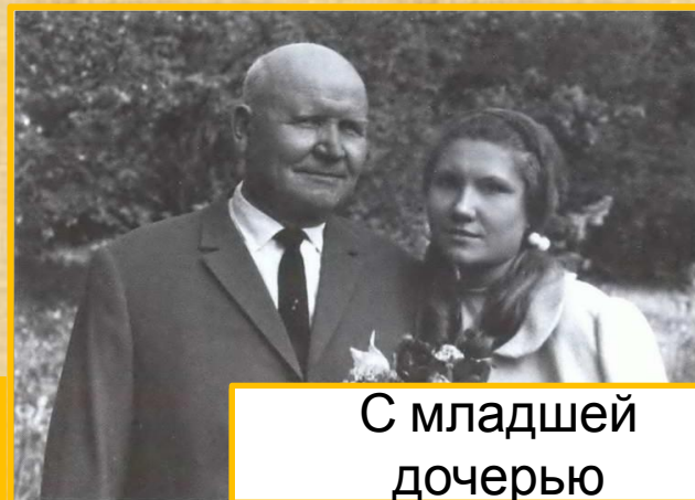
С младшей дочерью