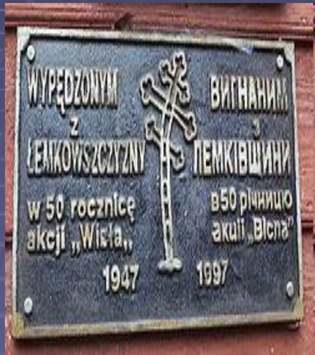
Пам'ятник жертвам операції «Вісла» у Низьких Бескидах