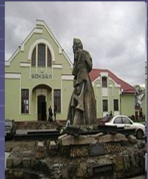
Пам'ятний знак депортованим українцям з Лемківщини, Холмщини, Надсяння, Підляшшя у місті Самборі (Львівщина)