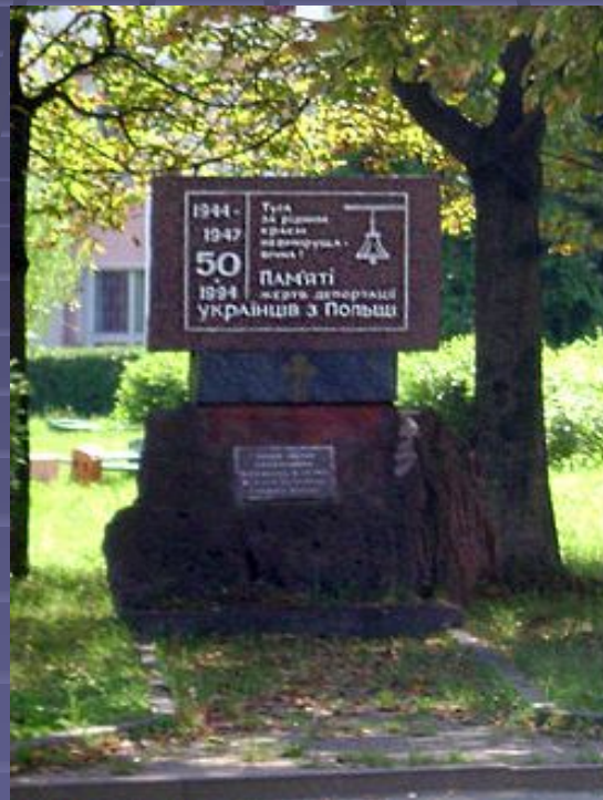
Пам'ятник жертвам депортації встановлений у місті Долина (Івано-Франківщина)