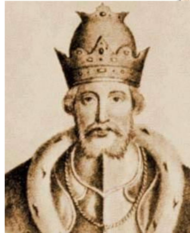
Юрий Данилович Московский

В 1304–1317 гг. ярлык находился в Твери.