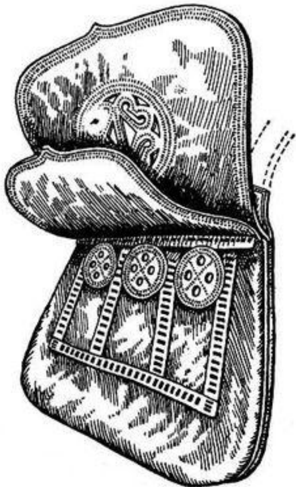
Сумка для денег – калита

Этим строительством Москва предьявляла претензии на статус столицы, ведь Успенским был главный собор Владимира.