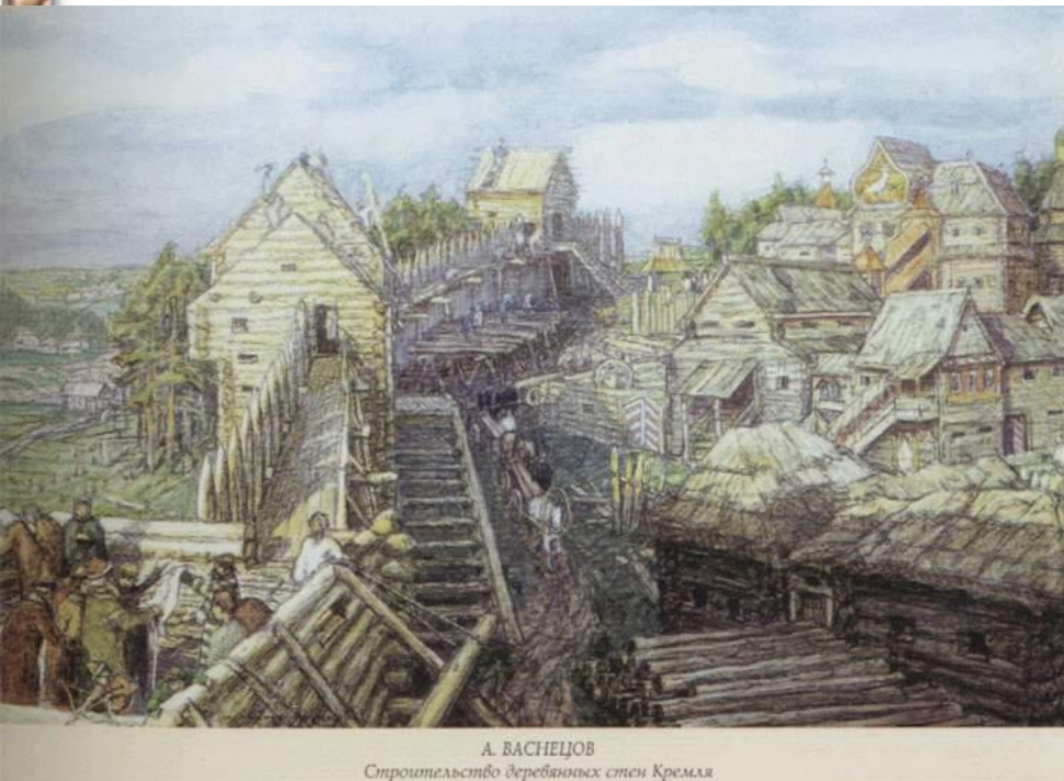
А. ВАСНЕЦОВ Строительство деревянных стен Кремля