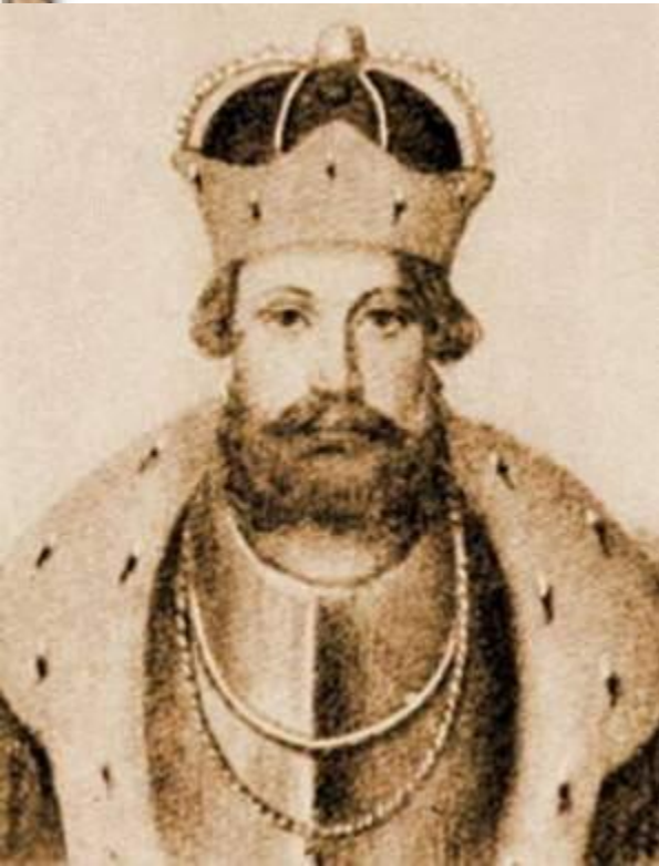
Михаил Ярославич Тверской

В 1304 г. умер великий князь Владимирский Андрей Александрович.