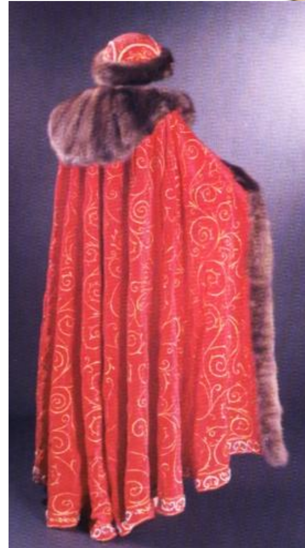
Княжеский костюм XIII-XIV веков

Но в 1317 г. Узбек, встревоженный усилением Твери, передал ярлык на великое княжение Юрию, женил его на своей сестре Кончаке (Агафье) и дал ему войско для борьбы с Тверью.