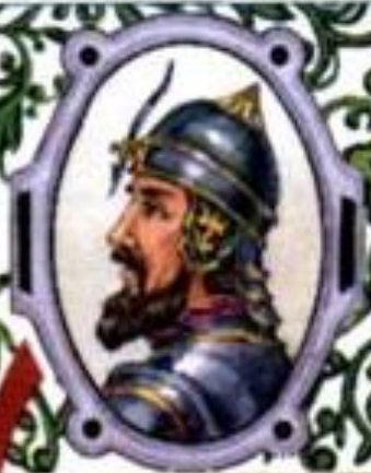
Александр Невский (1220—1263) великий князь Владимирский с 1252 г.