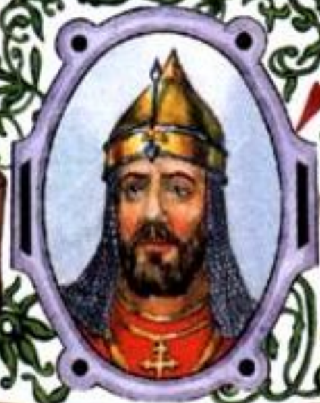
Дмитрий Донской (1350—1389) великий князь Московский с 1359 г., великий князь Владимирский с 1362 г.