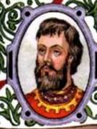
Иван Калита (?—1340) князь Московский с 1325 г. князь Владимирский с 1328 г.