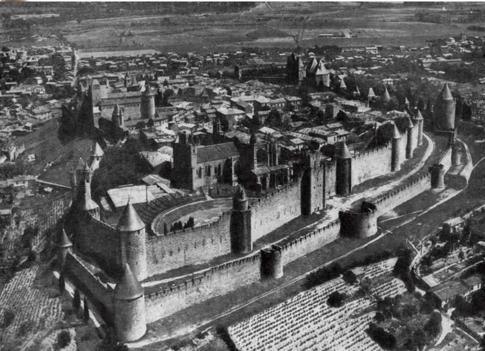
Стены г. Каркассона (Франция, XIII в.)

Почему европейские средневековые города могли стать опорой королевской власти в борьбе за объединение своих стран?