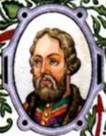
Иван Красный (1326—1359) великий князь Владимирский и Московский с 1353 г.