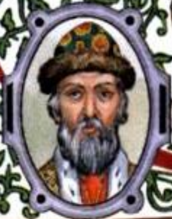
Даниил Александрович (1261—1303) князь Московский с 1276 г.