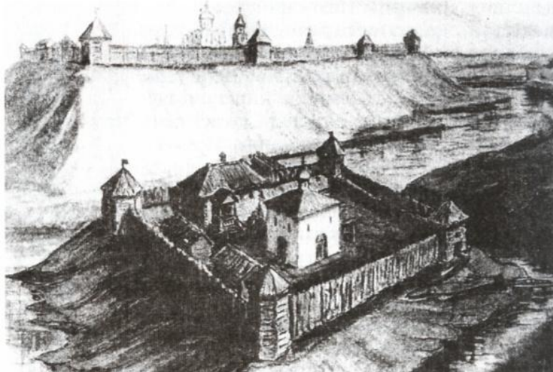
Укрепления Древней Твери