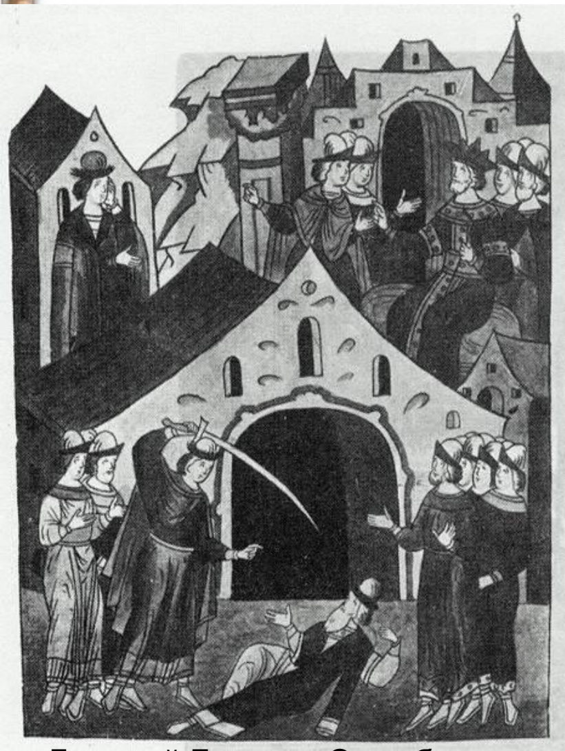
Дмитрий Грозные Очи убивает Юрия Даниловича в Орде

Великим князем стал его брат Александр Михайлович.