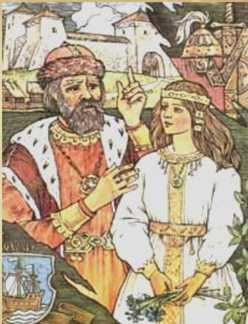
Рагнеда з бацькам Рагвалодам