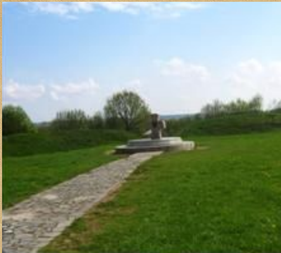
Курган Рагнеды ў Заслаўі