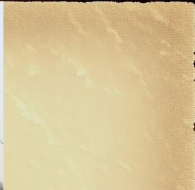
Помнік Рагнедзе і Ізяславу ў Заслаўі