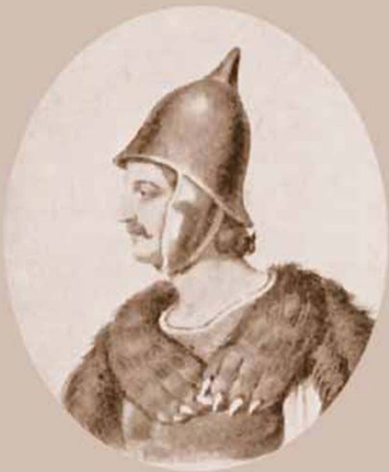
Кіеўскі князь Яраполк