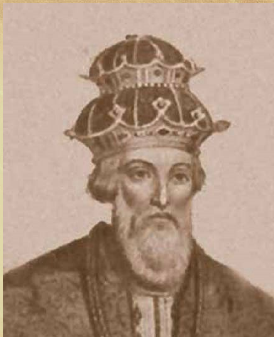
Наўгародскі князь Уладзімір