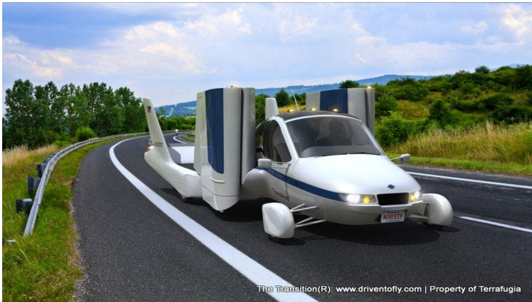
The Transition(R): www.driventofly.com | Property of Terrafugia