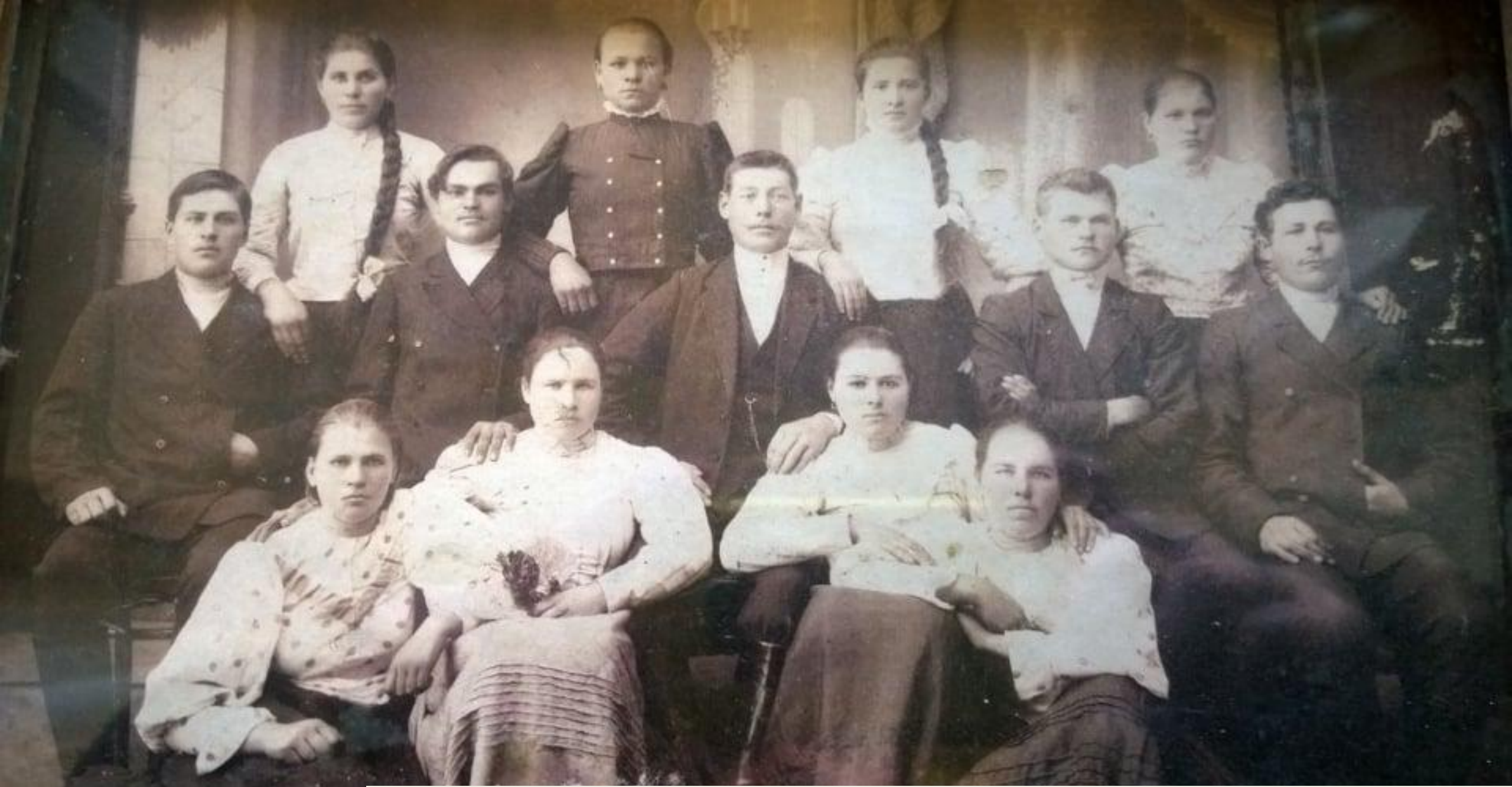
1914 рік. Дівчата проводжають хлопців на Першу