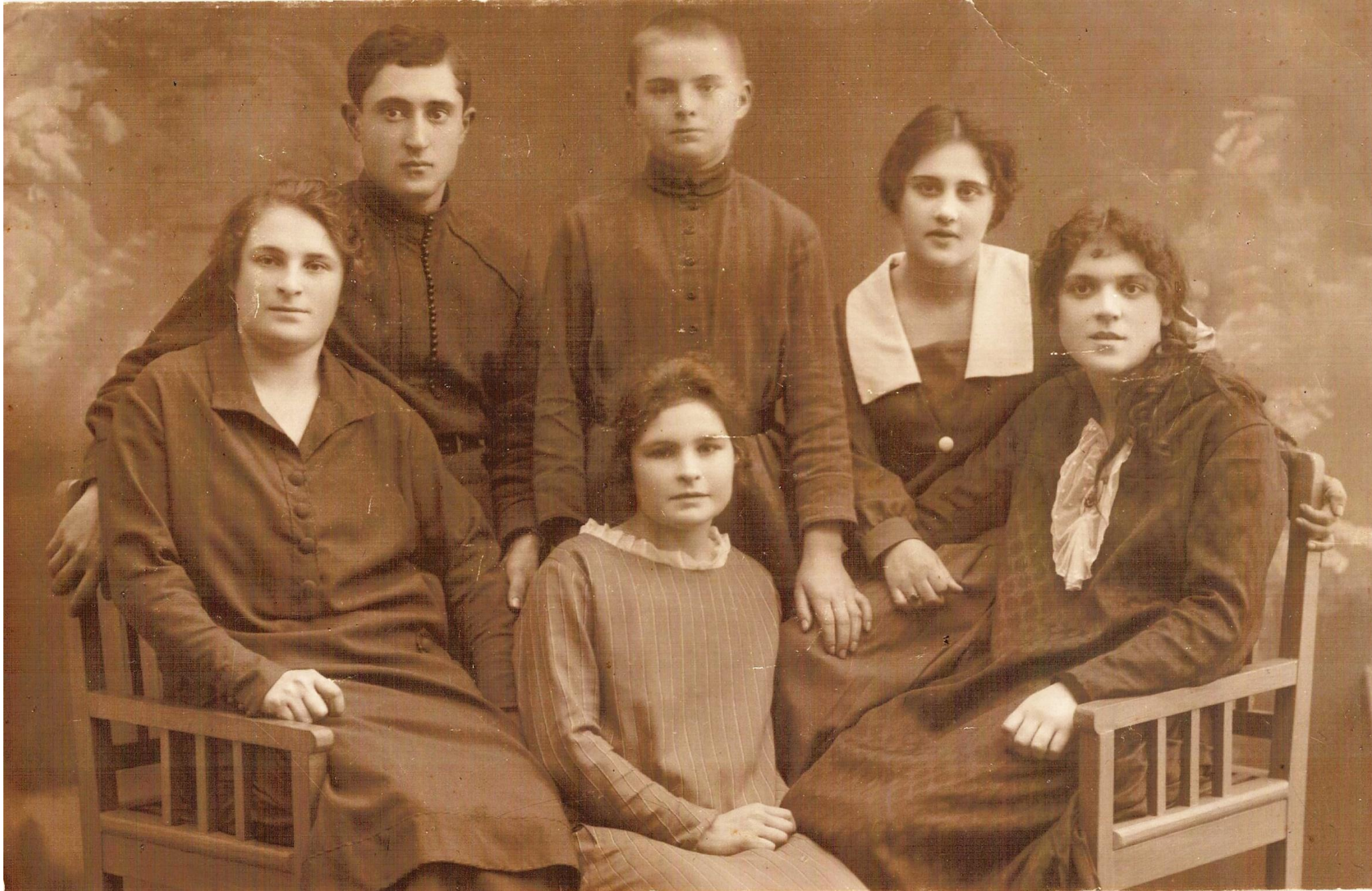
Рятуючись від репресій, родина Казарових вирішила емігрувати