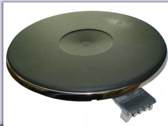
конфорка для электроплиты