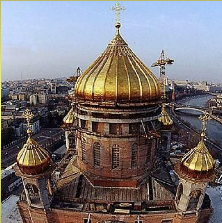
Первоначальный вид храма.