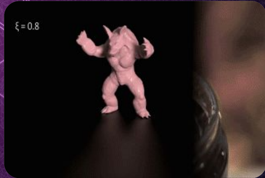
Деформация 3-х различных веществ, с различной вязкостью