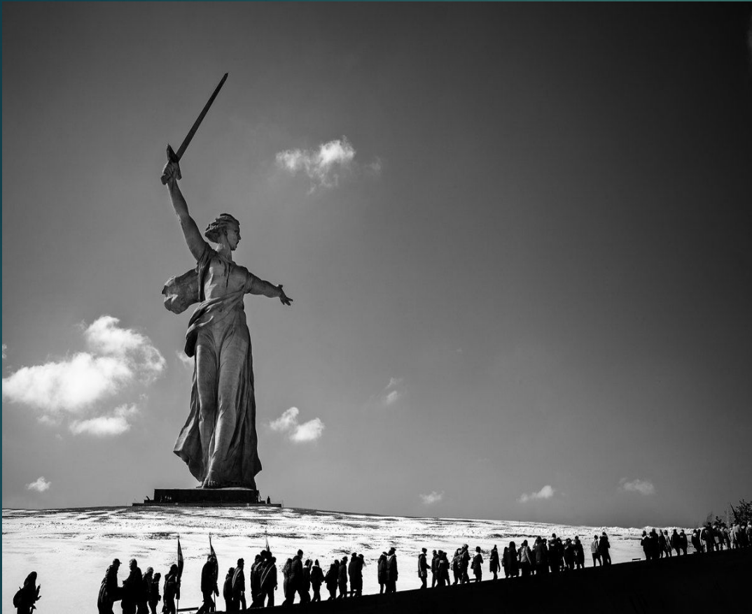
Родина - мать