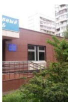
РИТМ ул. Кунцевская, д. 6