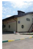
АЛЬБАТРОС ул. Рассказовская, д. 31