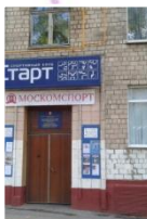
СТАРТ Кутузовский просп., д. 71