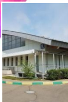
ВОСХОД ул. Щорса, д. 6