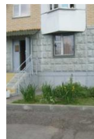
ЛАДЬЯ ул. Матвеевская, д. 36