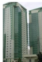
СЕМЬЯ ул. Покрышкина, д. 3