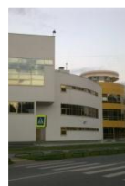
СОЛНЕЧНЫЙ ул. 50 лет Октября, 2Г