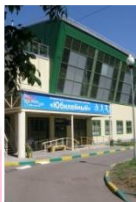
ЮБИЛЕЙНЫЙ ул. Мосфильмовская д. 41